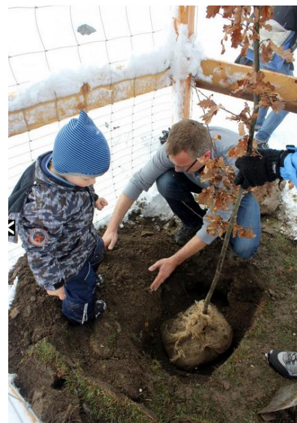
Abb. 1 : Abgestorbene Alteichen werden durch Jungbäume ersetzt. Die sogenannten Eichenpatenschaften bieten die Möglichkeit, die Verbundenheit der Bevölkerung mit ihrem Eichenwald weiter zu stärken.

Die Stadt Maienfeld ist sich der grossen Bedeutung ihres Natur- und Kulturerbes bewusst und setzt sich für die nachhaltige Pflege und Nutzung der Eichenhaine ein. Die heute rund 380-jährigen Alteichen werden bis zu ihrem natürlichen Tod stehengelassen und dienen so noch lange Zeit als Biotoppäume. Damit die Zahl der Eichen nicht abnimmt, werden abgestorbene Bäume ersetzt und so eine Verjüngung des Bestandes angestrebt. Sogenannte Eichen-Paten pflanzen die Jungeichen und sind in den ersten Jahren auch für deren Bewässerung und Pflege verantwortlich. Aus dem Holz der abgestorbenen Bäume werden wenn möglich Weinfässer hergestellt, welche bei den einheimischen Produzenten als Unikat versteigert werden.